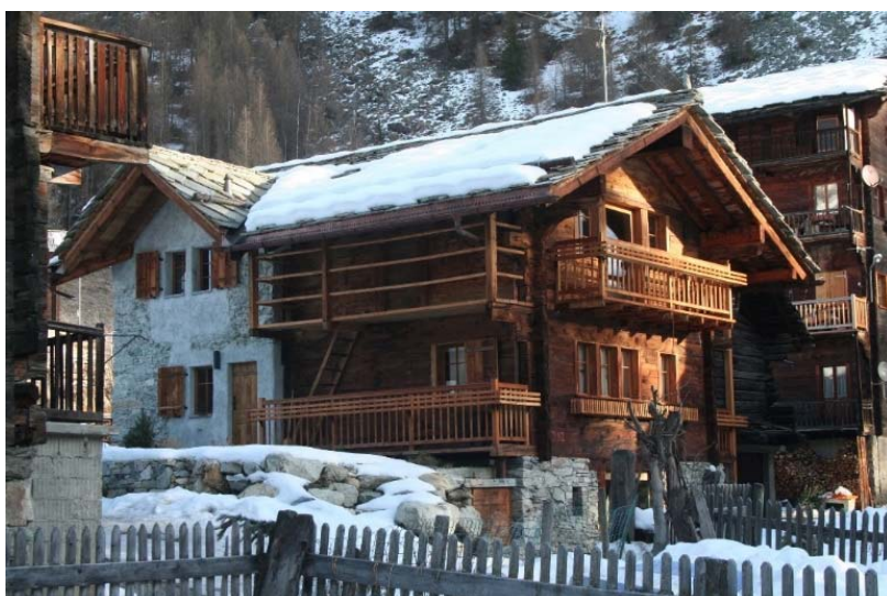
Maison villageoise rénovée