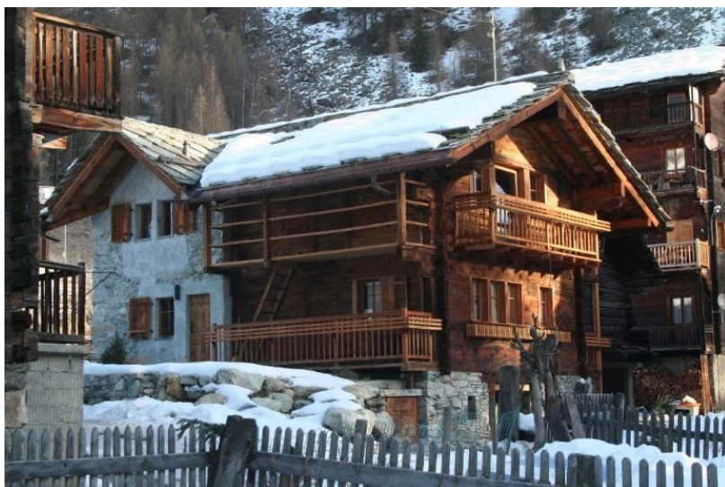
Maison villageoise rénovée