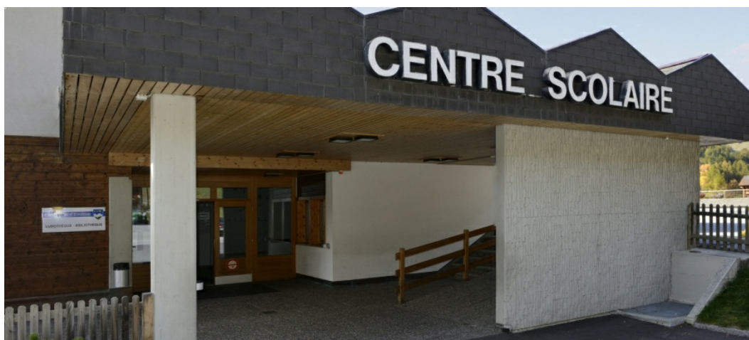
Bureau de vote